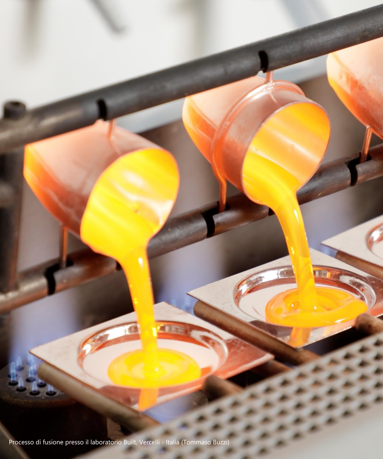
Processo di fusione presso il laboratorio Built, Vercelli - Italia (Tommaso Buzzi)