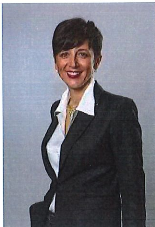
Founding Partner - Starcllex Born in Piacenza on March 18, 1973